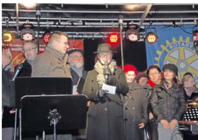
Der Rotary Club Gladbeck Kirchhellen hatte ein stimmungsvolles Benefizkonzert organisiert.