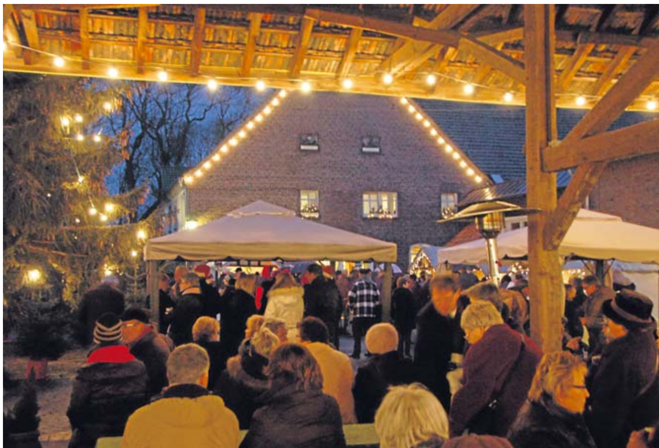
Zwischen den Ständen kam mit Kartoffelpuffern, Waffeln, Bratwurst und Glühwein Weihnachtsstimmung auf.